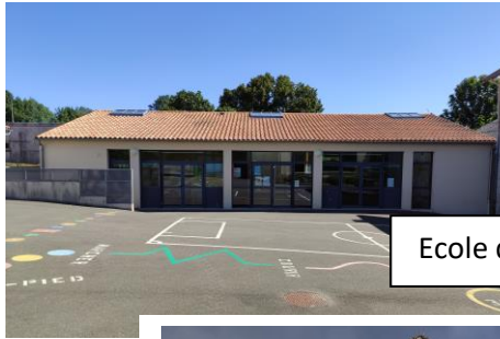
Ecole du petit train